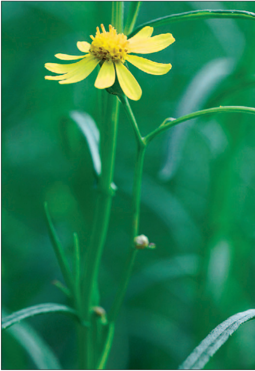
Fig. 15. Séneçon du Cap [ Senecio inaequidens DC.]

un herbier d'une extrême densité. Elle affectionne tout particulièrement les courants lents et les eaux stagnantes des rivières et des étangs, ainsi que les fossés, les marais et les prairies humides. Mais elle se développe également le long des grandes rivières (Garonne, Loire, Rhône, Durance, Gardon, Hérault) et même dans les marais du littoral méditerranéen. Elle est capable de coloniser un plan d'eau jusqu'à une profondeur de 2 à 3 mètres.