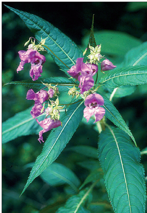
Fig. 7. Impatiante glanduleuse [ Impatiens glandulifera Royle]

Cette belle plante de la famille des balsaminacées est