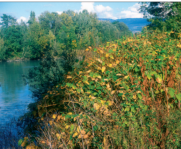
Fig. 6. Renouée du Japon au bord de l'Arve

d'autre part. Il s'agit de plantes touffues, buissonnantes, atteignant trois mètres de hauteur. Leur magnifique feuillage d'un vert intense se pare d'or en automne ; les feuilles de l'espèce sachalinensis peuvent dépasser 30 centimètres de longueur ; les petites fleurs, blanches à verdâtres, sont groupées en faisceaux axillaires de grappes plus ou moins dressées ; la reproduction sexuée est parfois inexistante, parfois secondaire, remplacée par une reproduction végétative exubérante (cf. stratégies adaptatives) ; ces deux sœurs peuvent toutefois s'hybrider et donner naissance à des plantes morphologiquement intermédiaires ( R. x bohémica ).