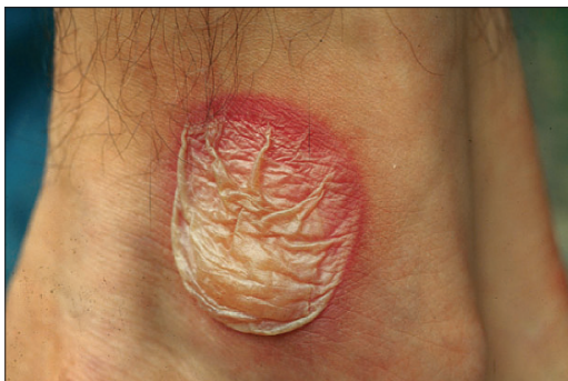
Fig. 2. Dermatose due à la Berce du Caucase.

Cette plante est un fléau médico-social en Irlande et en Angleterre ; il commence à le devenir en Suède ainsi qu'en Europe de l'Est. Si l'on n'agit pas rapidement chez nous, il finira tôt ou tard par nous concerner également.