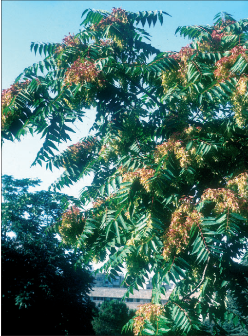
Fig. 11. Ailante ou faux vernis du Japon [ Ailanthus altissima (Miller) Swingle]

Atteintes écologiques : L'ombrage formé par le Buddleia modifie la végétation en place et la dynamique de recolonisation. La rapidité de croissance, l'ampleur spatiale qu'occupe chaque pied, la quantité phénoménale de graines produites ne laissent aucune chance aux espèces indigènes. De plus, au bord des rivières, en prenant la place de la végétation indigène, le Buddleia modifie l'écosystème local.