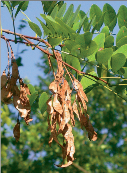
Fig. 9b. Robinier faux-acacia [ Robinia pseudoacacia L.] en fruits