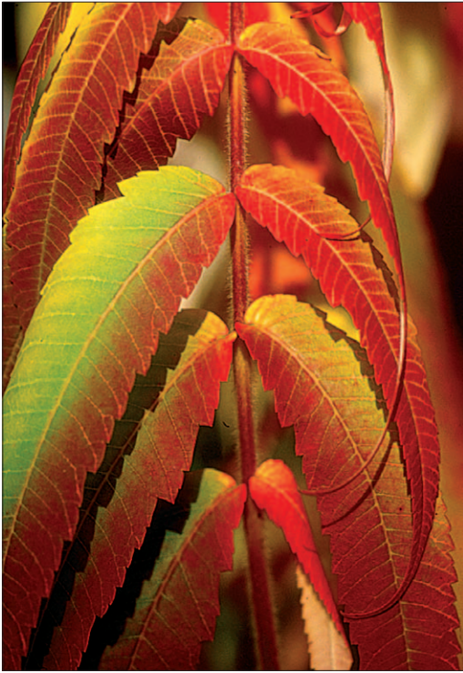
Fig. 13. Sumac [ Rhus typhina L.]