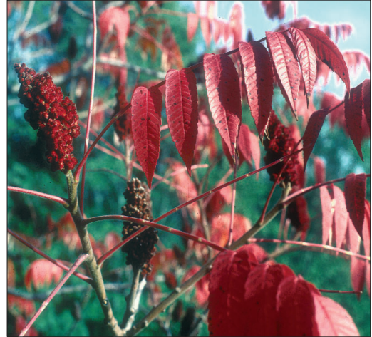
Fig. 12. Sumac ou Vinaigrier [ Rhus typhina L.]

Cet arbuste ou petit arbre, originaire d'Amérique du Nord,