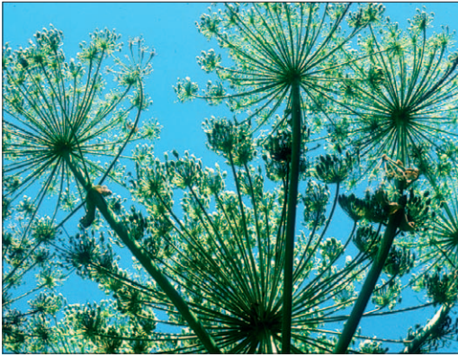
Fig. 3. Berce du Caucase [ Heracleum mantegazzianum Sommier & Levier]

accidentellement à la plante suffit à produire un nouvel individu en peu de temps !