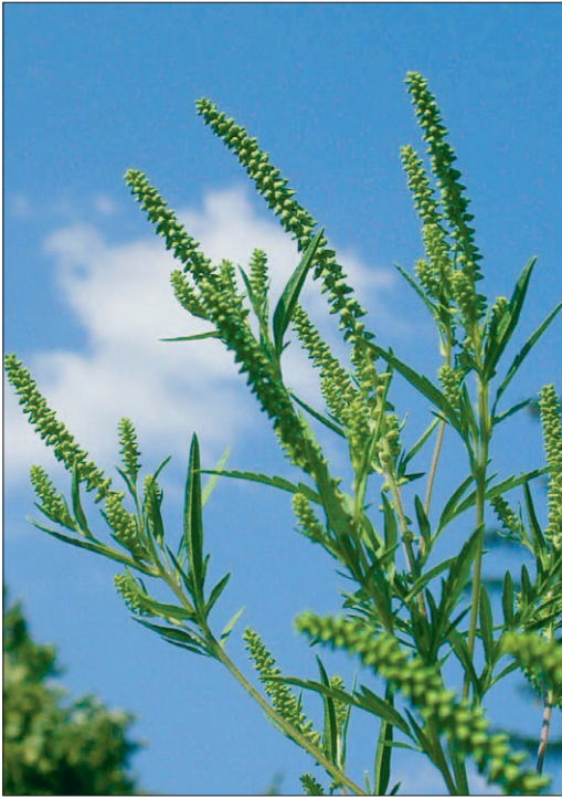
Fig. 16. Ambrosie [ Ambrosia artemisiifolia L.]