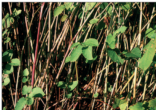
Fig. 1. Peuplement dense de Reynoutria japonica Houtt