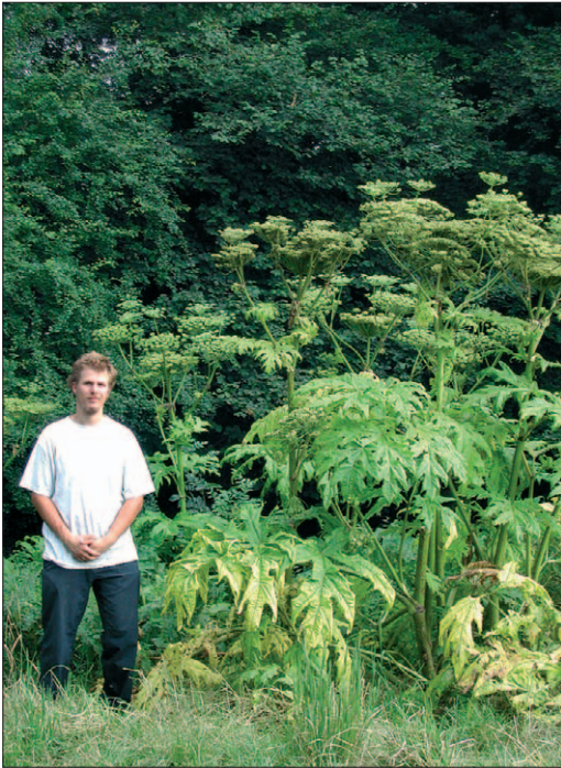
Fig. 4. Berce du Caucase [ Heracleum mantegazzianum Sommier & evier]