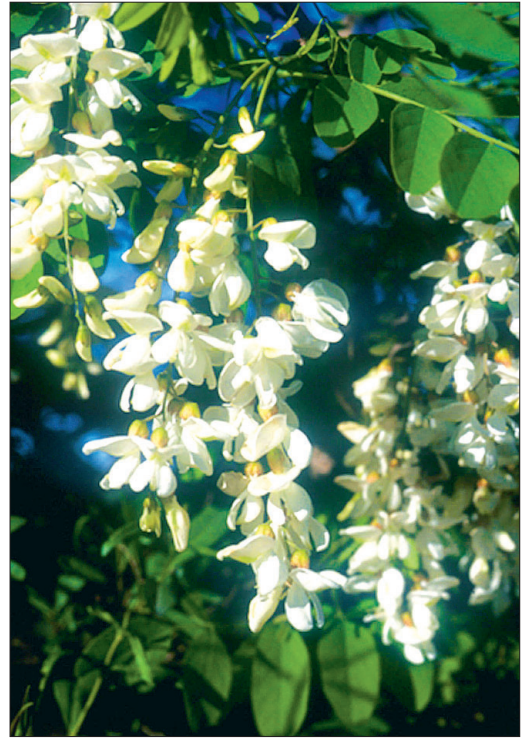
Fig. 9a. Robinier faux-Acacia [ Robinia pseudoacacia L.] en fleurs

Atteintes écologiques : Les solidages forment une couverture si dense qu'ils étouffent la végétation environnante.