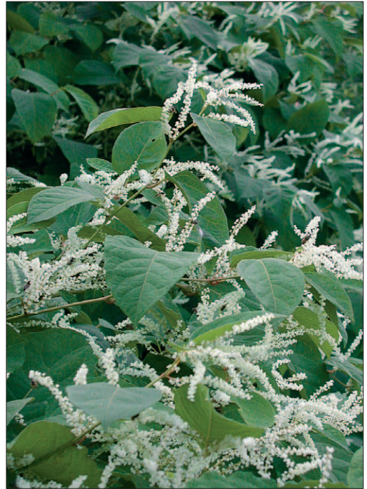
Fig. 5. Renouée du Japon [ Reynoutria japonica Houtt.]