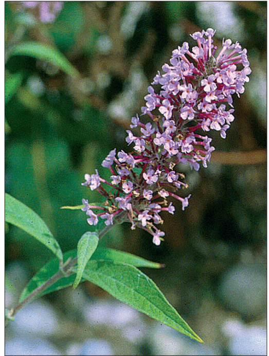
Fig. 10. Buddléia ou arbre à papillons [ Buddleja davidii Franchet]

Atteinte écologique : depuis quelques années, sa progression se généralise, il envahit tous les talus et concurrence les espèces indigènes.