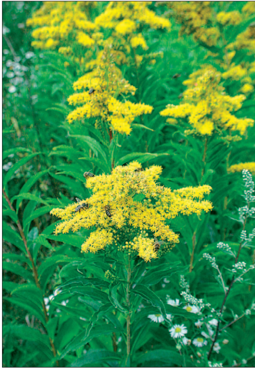
Fig. 8. Solidago géant [ Solidago gigantea Aiton]

Les solidages géants et solidage du Canada (fig. 8) [ Solidago gigantea Aiton ; Solidago canadensis L.]